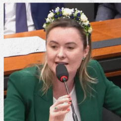
Recurso é de autoria da deputada Julia Zanatta (PL-SC)

A CCJ (Comissão de Constituição e Justiça e de Cidadania) da Câmara dos Deputados aprovou um recurso da deputada Julia Zanatta (PL-SC) que busca rediscutir a obrigatoriedade da vacinação contra a covid-19 em crianças entre seis meses e cinco anos.